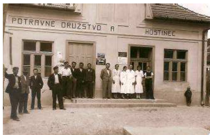
Potravné družstvo a hostinec - r. 1930