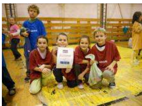
Víťazné družstvo v športovej súťaži Pohňi kostrou