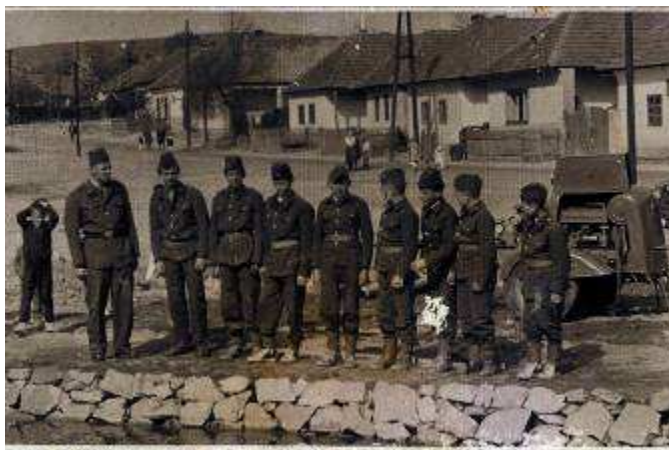
Hasičská súťaž v Janovej Vsi