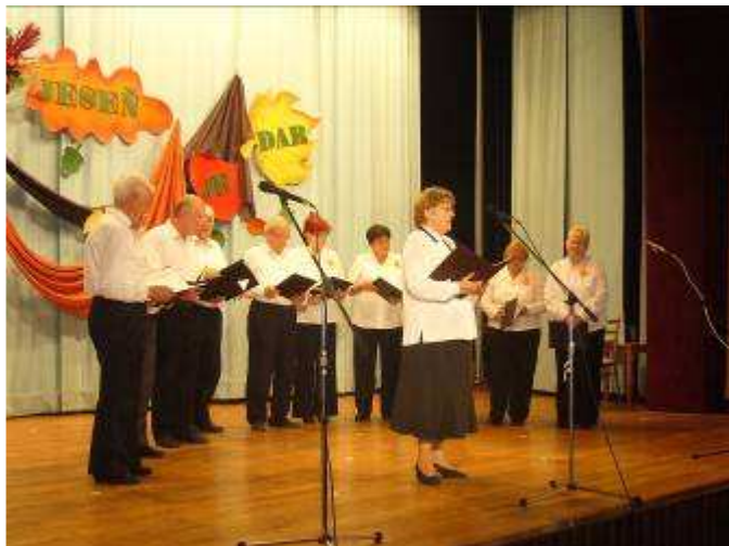
Obr. Vystúpenie vo Veľkých Uherciach