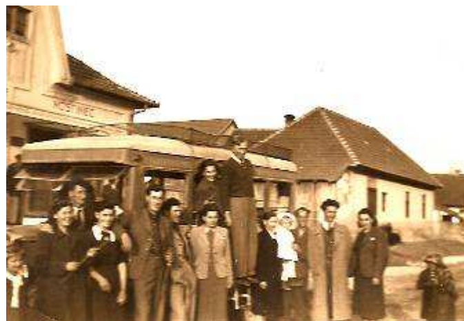
Autobus do Topoľčian rok 1941