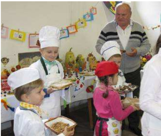
Obr. Deti z MŠ Klátova Nová Ves

Originálnym a milým oživením celej výstavy bolo vystúpenie detí z materskej školy, ktoré vo vkusnom oblečení dobových čašníkov ponúkali prítomných čerstvými domácimi koláčikmi, zákuskami i ovocím.