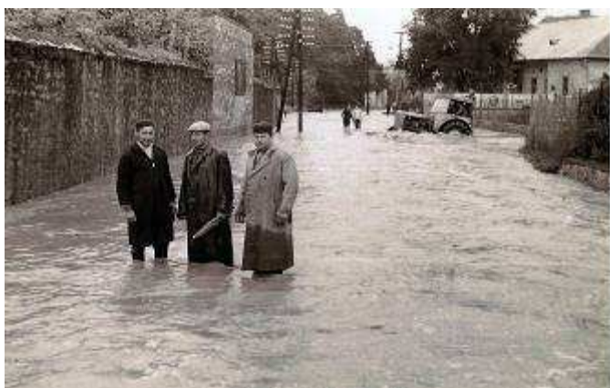
Povodeň Klátova Nová Ves – rok 1965