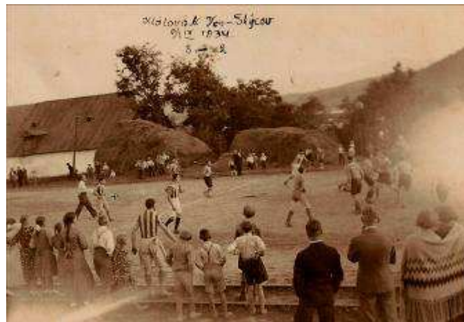
Futbalový zápas Klátova Nová Ves – Skýcov rok 1934

Pre ilustráciu Vám prinášame zopár záberov viac na www.klatovanovaves.sk