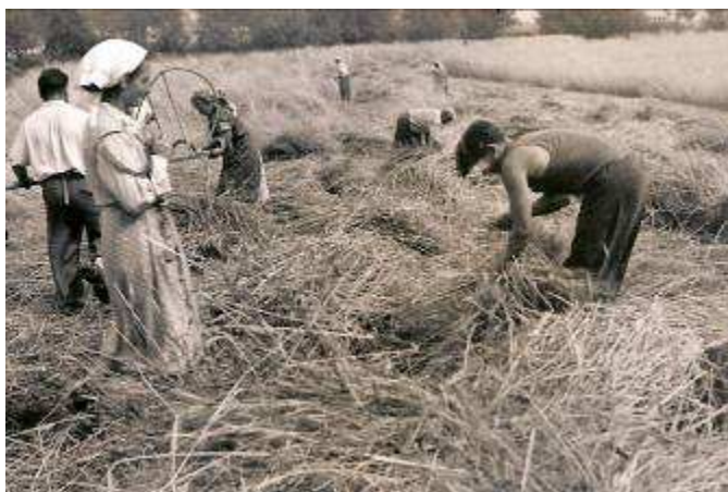
Žatva – Janova Ves rok r. 1956