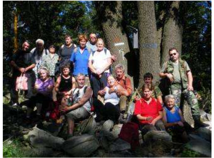
Obr. Účastníci výstupu na Javorov vrchu

Po chvíľke sme sa vydali smerom na Podskalje, kde bola krátka zastávka. Prežili sme ju v kruhu rodákov, ktorí trávili víkend na chate. Šiesti z nich sa pripojili k nám: štyria z Nových Zámkov a dvaja z Partizánskeho. Výstup pokračoval cez Dieťa na Onžiar, kde sme sa občerstvili a pokračovali sme hore do kopcov až do cieľa nášho výstupu na Javorov Vrch (730m).