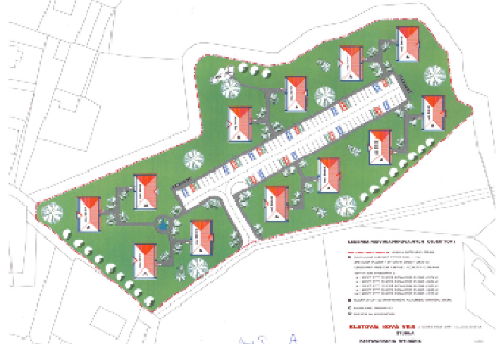
Obr. Návrh zastavovacej štúdie obecných nájomných bytov