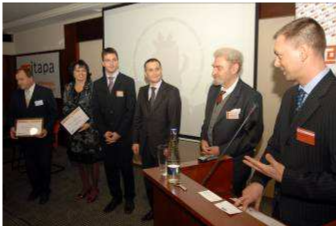
Obr. Slávnostné vyhlásenie výsledkov

Súťaž Zlatyerb.sk každoročne vyhlasuje spoločne Únia miest Slovenska a občianske združenie eSlovensko pod záštitou vysokých ústavných činiteľov SR. Hlavným cieľom súťaže je podporiť informatizáciu slovenských samospráv, oceniť výnimočné projekty a podporiť snahu zástupcov samospráv účinne využívať informačno-komunikačné technológie k zvyšovaniu kvality a služieb samosprávy. Počas medzinárodnej konferencie ITAPA v Bratislave 9. novembra 2010 organizátori slávnostne vyhlásili výsledky súťaže.