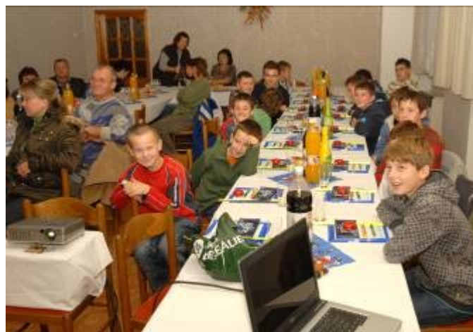
Obr.: Vyhonotenie futbalovej súťaže žiakov