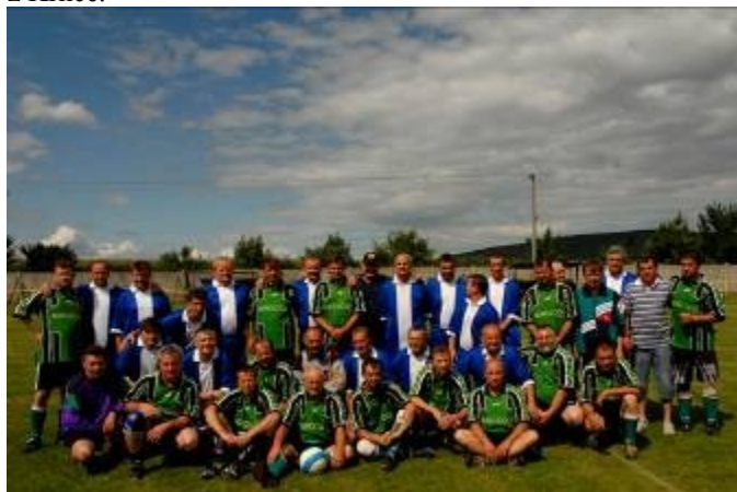
Oživením turnaja bol zápas domácich starých pánov s mužstvom z Veľkého Klíža (na snímke). -r-

V. ročník futbalového turnaja o „Pohár starostky obce“ sa konal druhú júlovú nedeľu za účasti mužstiev z Nadlíc, Krnče, SMER-u SD a domácich. Víťazný pohár, po prvýkrát aj putovný, si odniesli hráči z Nadlíc, na druhom mieste skončil SMER-SD, bronz zostal doma a štvrté miesto patrilo mužstvu z Krnče.