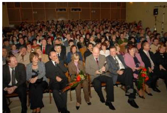
Obr. Publikum, v popredí čestní hostia