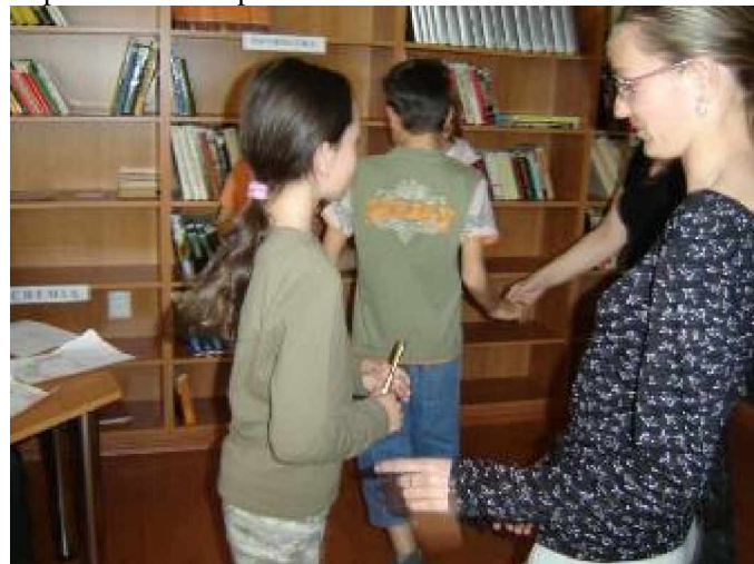
Obr. Literárny kvíz

Knižnica sa využíva na hodinách čítania, slovenského jazyka a prvouky. Žiaci sa zoznamujú s encyklopédiami a učia sa s nimi pracovať. V jej priestoroch sa konali literárne súťaže pre žiakov I. stupňa. Žiaci získali nové vedomosti o spisovateľovi rozprávok Pavlovi Dobšinskom.